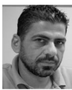
Του Παναγιώτη Τσαγγάρη @tsangaris

Τι ΜΟΕ και κουραφέξαλα; Συζητούμε για συνολική λύση και ακόμη θέλουμε ΜΟΕ; Τηλεφωνία λέει ο Ακκιντζί. Μα αγαπητέ μου, η Κύπρος έχει διεθνή κωδικό, το «00357». Υιοθετήστε τον και τελείωσε το παραμύθι... Η εννοείτε ότι με τη λύση θα θέλετε και ξεχωριστό κωδικό; Αυτό μας έλειπε τώρα!